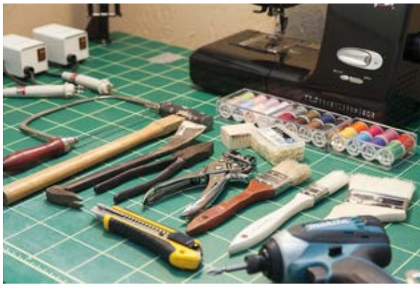
新設『シェアDIYスペース』2