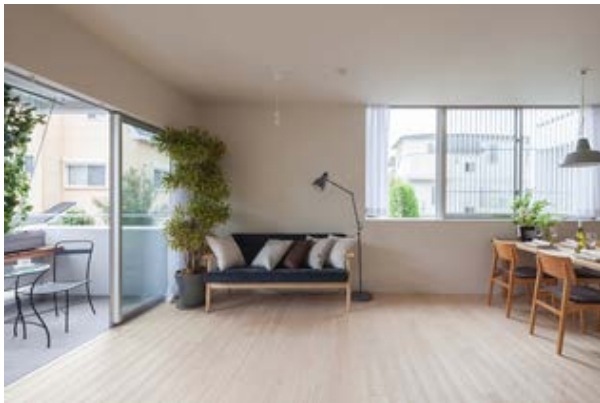
ご提案新築マンション事例