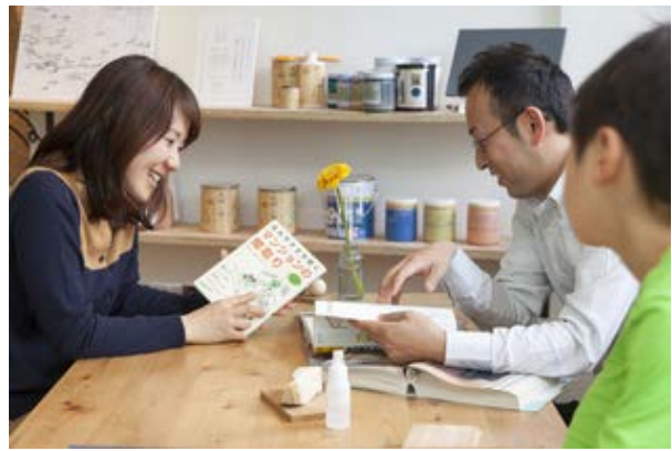
接客風景『てまひま不動産』ブース