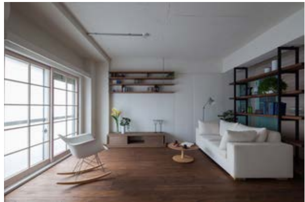
ご提案リノベーション事例