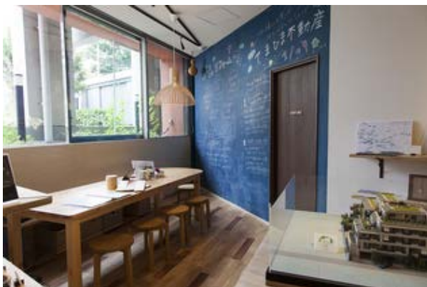
新設『てまひま不動産』ブース